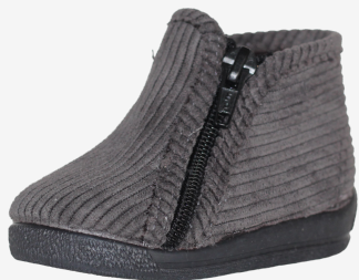
GRIS PLOMO 24