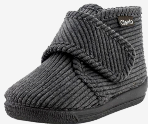
GRIS PLOMO 24